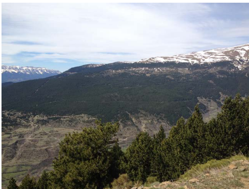
Figura 1. Cara Norte-Este de la montaña de Meranges

El conjunto de parcelas se han instalado en la montaña de Meranges, bosque número 21 del Catálogo de Utilidad Pública de Gerona, de propiedad del municipio de Meranges y situado en la Cerdanya, comarca de montaña del Pirineo Catalán. Este bosque es Espacio Natural de Protección Especial y forma parte del sistema de certificación de gestión forestal sostenible (PEFC). La montaña de Meranges tiene una superficie de 3.415 ha de las cuales la vegetación arbolada está totalmente dominada por el P. uncinata , aunque en las cotas más bajas se pueden encontrar algún sector en el que P. uncinata se mezcla con P. sylvestris .