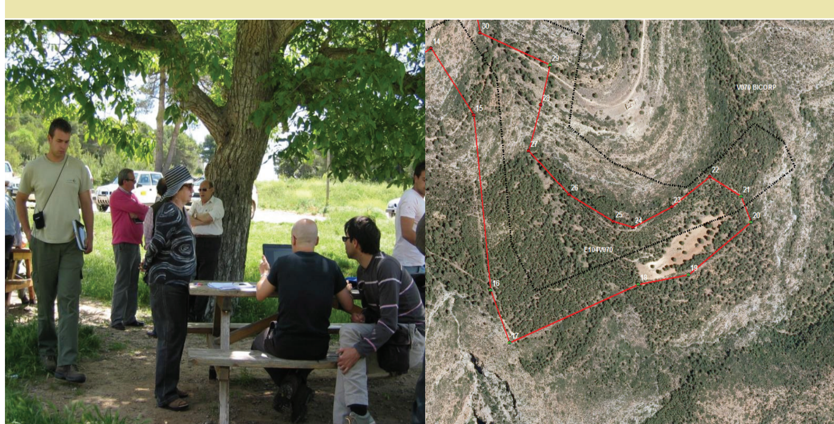
Revisión de datos y generación de cartografía definitiva