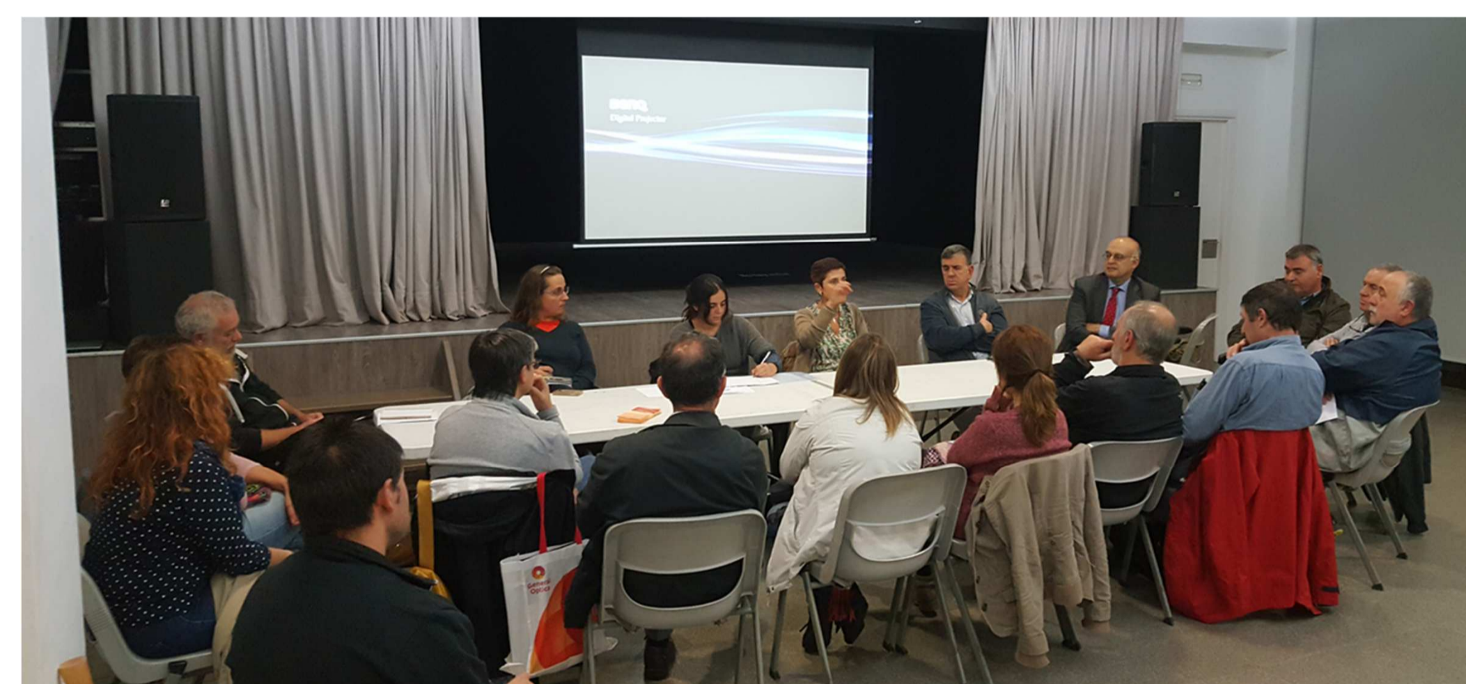
Reunión del Grupo de Trabajo con todos los sectores implicados

Distribución geográfica de los recorridos de la mayor parte de actividades a pie informadas en 2016. En colores el nº de recorridos que pasan por cada tramo. Muchas de estas coinciden en las zonas cumbre, espacios especialmente sensibles