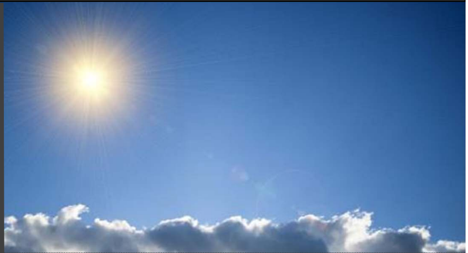
Reducción de emisiones