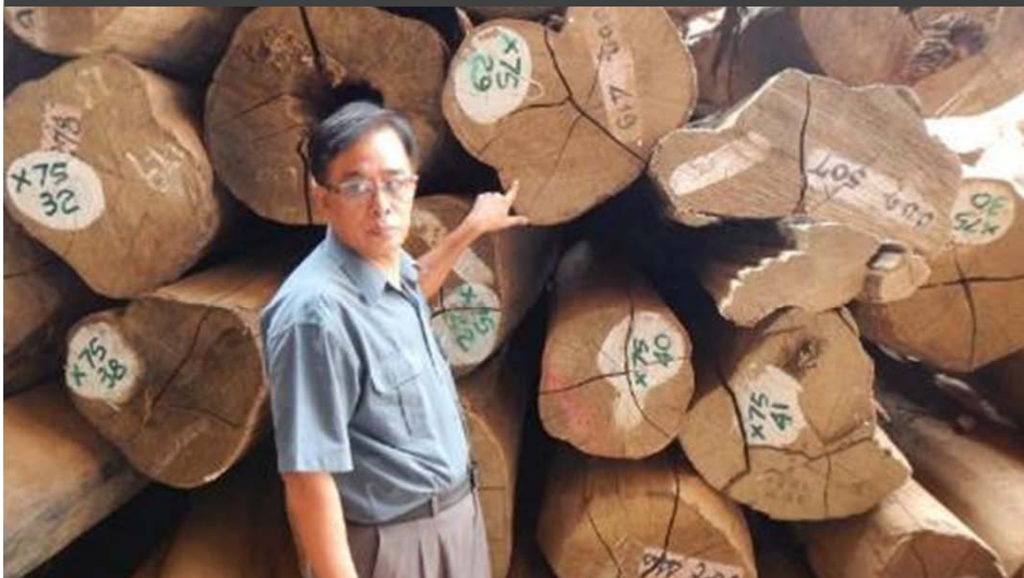
Legalidad de la madera