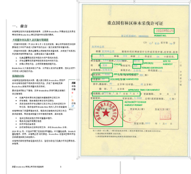
Figure 32: Example Harvest Permit issued by the State Forestry Administration for key State-owned forests